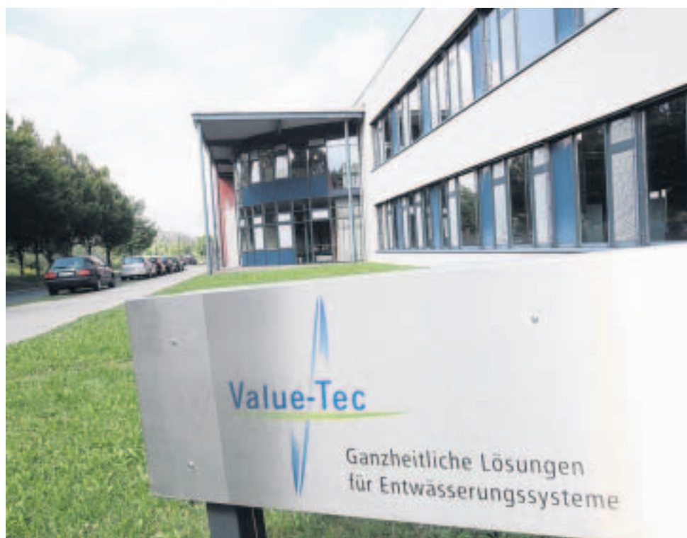
Die Firma Value-Tec bezog eine Hälfte des ehemaligen Bauwens und Vollack-Gebäudes im Erin-Park. 550 Quadratmeter bieten Platz für zukünftiges Wachstum.